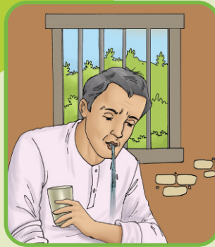
Person to rinse mouth व्यक्ति पानी से कुल्ला करें